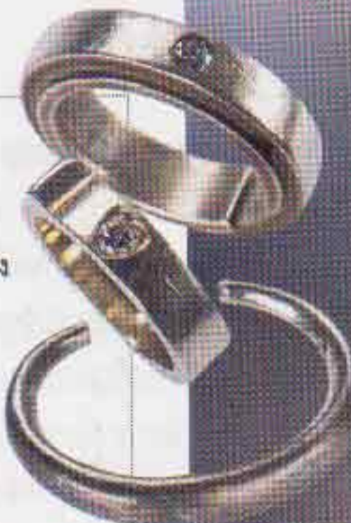
อาจารย์ประจำภาควิชาออกแบบเครื่องประดับ คณะมัณฑนศิลป์ ม.ศิลปากร