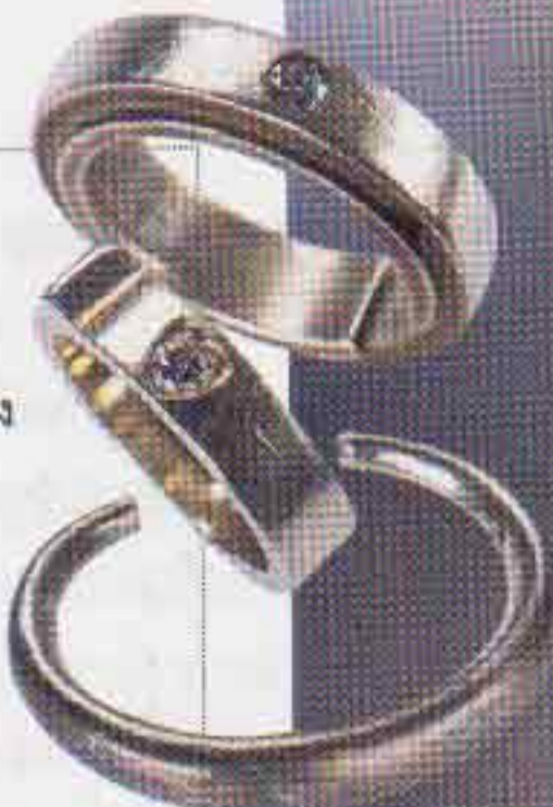
อาจารย์ประจำภาควิชาออกแบบเครื่องประดับ คณะมัณฑนศิลป์ ม.ศิลปากร